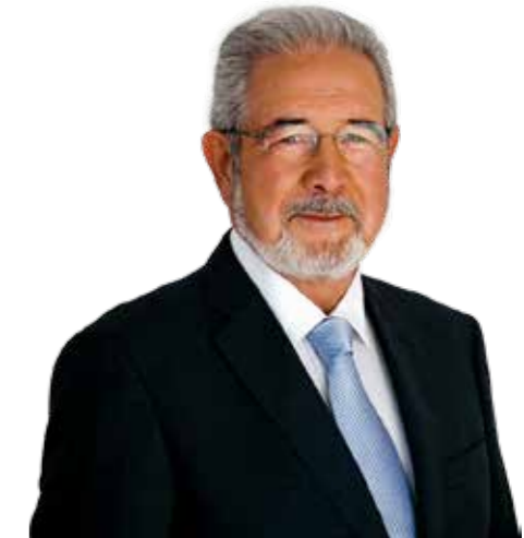
Isaltino Morais PRESIDENTE DA CÂMARA MUNICIPAL DE OEIRAS

Todos estes investimentos contribuem, em paralelo, para os objetivos de captação de novas empresas e criação de mais emprego , para a estratégia de internacionalização de Oeiras e para a afirmação do nosso concelho como um dos principais motores do desenvolvimento económico da Área Metropolitana de Lisboa e do País.