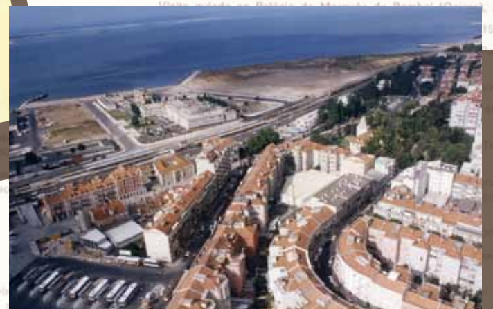
Vista aérea de Algés, 1994. Município de Oeiras, GC Cx 2/1994 F 74 Neg 8