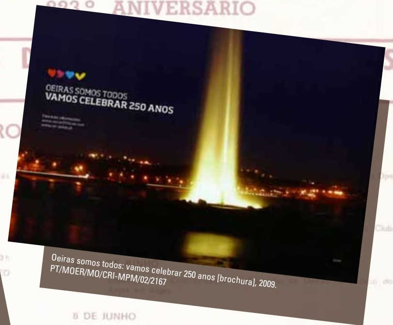
Oeiras somos todos: vamos celebrar 250 anos [brochura], 2009. PT/MOER/MO/CR1-MPM/02/2167