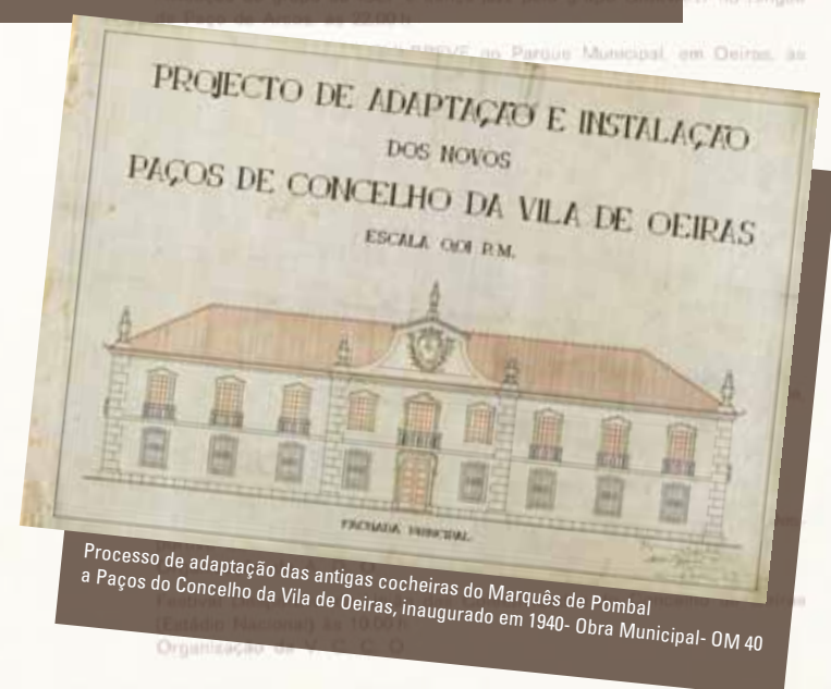
Processo de adaptação das antigas cocheiras do Marquês de Pombal a Paços do Concelho da Vila de Oeiras, inaugurado em 1940- Obra Municipal- OM 40