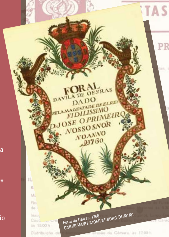
Foral de Oeiras, 1760. CMO/SAM/PT/MOER/MO/ORG-DO/01/01

O Arquivo Municipal é, hoje em dia, um serviço transversal. Tem vida num espaço concreto e respira no tempo atual. Revela memórias, partilha testemunhos, mostra de que são feitas as vivências do município.