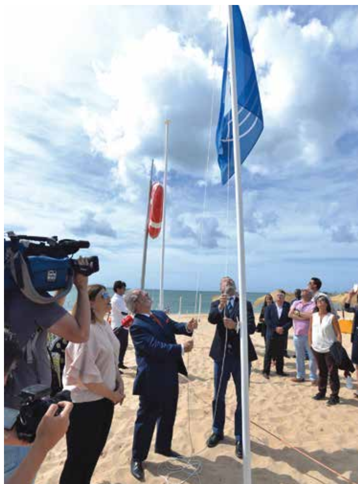
Hastear da Bandeira Azul na praia de Santo Amaro de Oeiras

Saber como está a praia antes de sair de casa é possível, graças ao Beachcam. pt, o site pioneiro na Europa na transmissão gratuita de imagens em tempo real (live broadcast) e na prestação de serviços de informação sobre as praias do litoral português, incluindo as de Oeiras: Caixas, Paço de Arcos, Santo Amaro e Torre. •