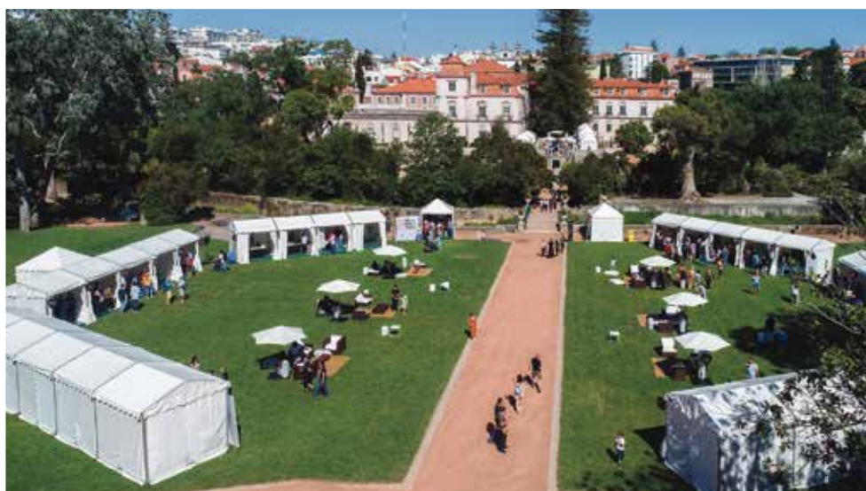
Centro Histórico de Paço de Arcos