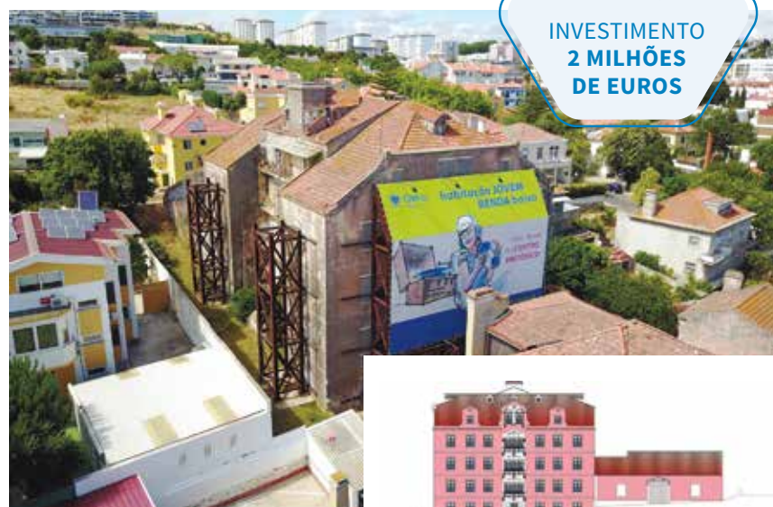
Edifício Villa Longa