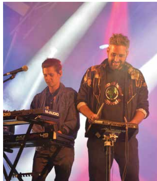
Finalistas do Oeiras Band Sessions