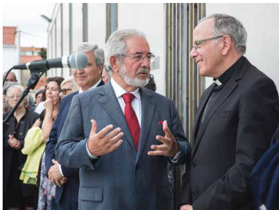
O Cardeal Patriarca de Lisboa, D. Manuel Clemente, marcou presença na inauguração