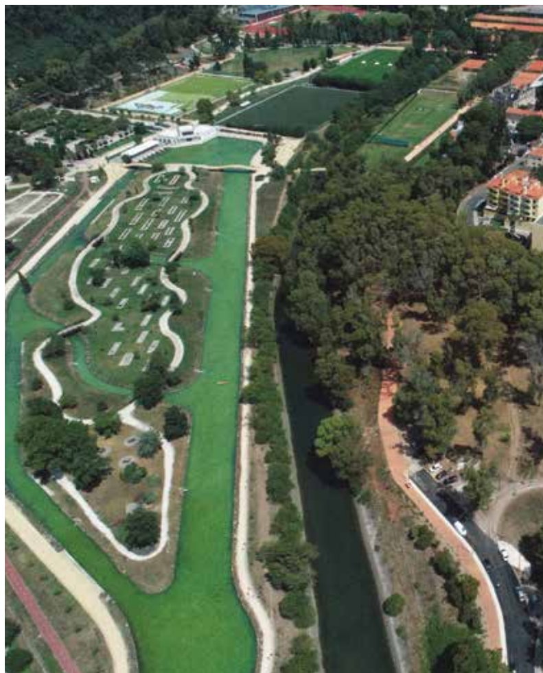
Percurso ao longo da margem do rio Jamor

Está a avançar a obra de criação do Eixo Verde e Azul do rio Jamor – 1.º troço, correspondendo à construção de uma via pedonal e ciclável entre a Cruz Quebrada e o Santuário da Senhora da Rocha.