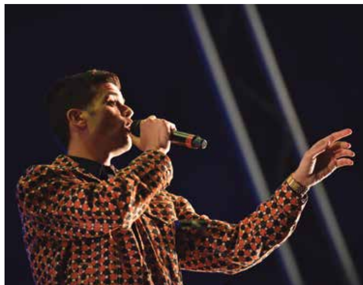
Banda Municipal com FF