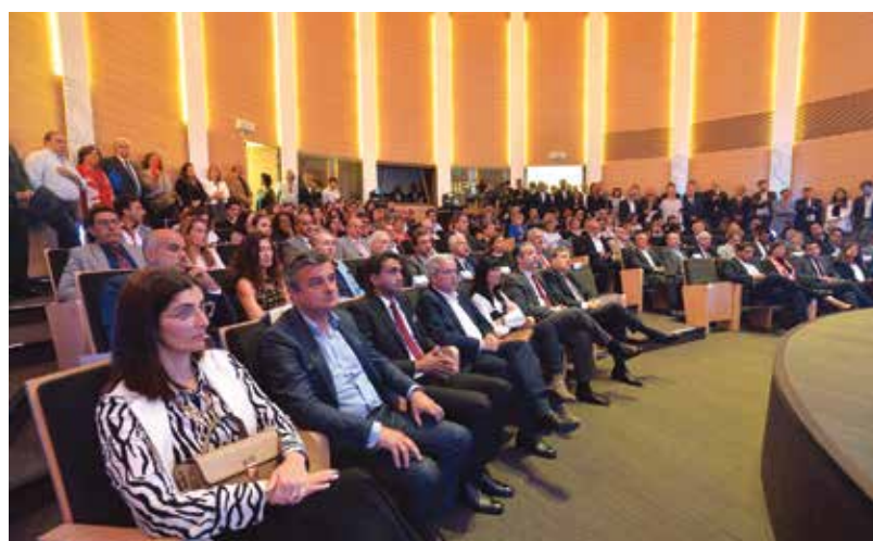
O Templo da Poesia encheu-se para a apresentação do conceito Oeiras Valley

Atualmente, há já um conjunto de empresas de grande dimensão no concelho – diversas multinacionais ligadas aos setores mais inovadores, designadamente às Tecnologias de Informação e Comunicação (Cisco, HP, Google, entre outras) e à área da Saúde/Farmacêutica (MSD, Pfizer, Novartis, etc.) e que determinam a especialização produtiva concelhia, sendo responsáveis por parte significativa da riqueza aqui gerada. •