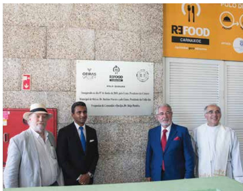
Inauguração do núcleo de Queijas da Re-Food