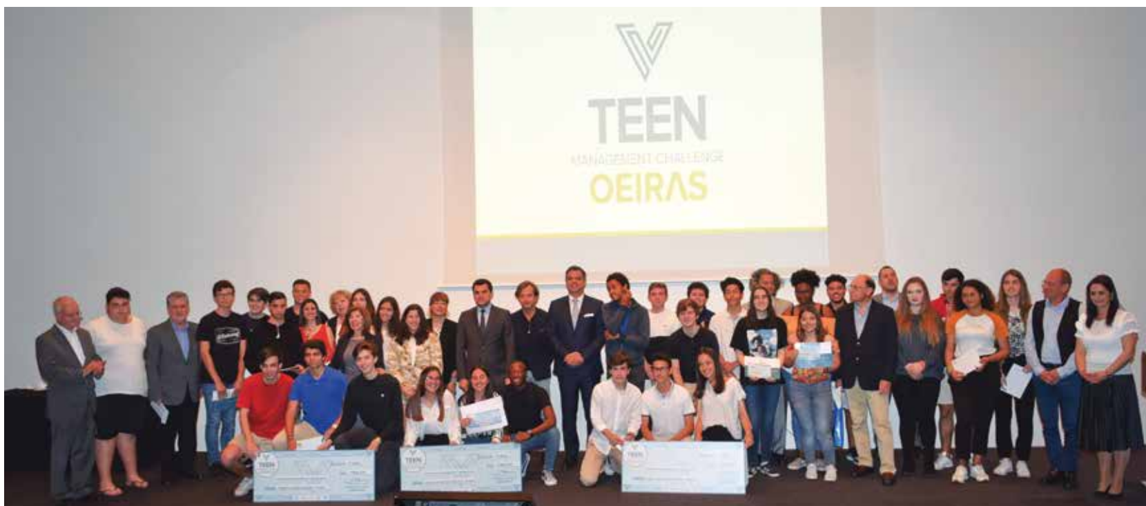
Os participantes da primeira edição do Teen Management Challenge Oeiras