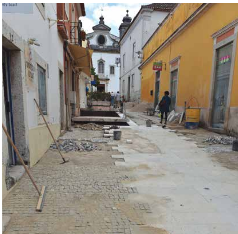
Rua Febus Moniz, obra em curso

No âmbito da estratégia de requalificação do espaço público do centro histórico de Oeiras, a Câmara Municipal de Oeiras procedeu à obra de repavimentação das Ruas 7 de Junho e Febus Moniz no Centro Histórico de Oeiras, com o intuito da melhoria do conforto urbano e condições de mobilidade.