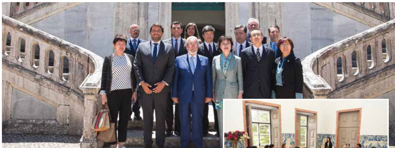
A delegação de Pequim recebida no Município de Oeiras