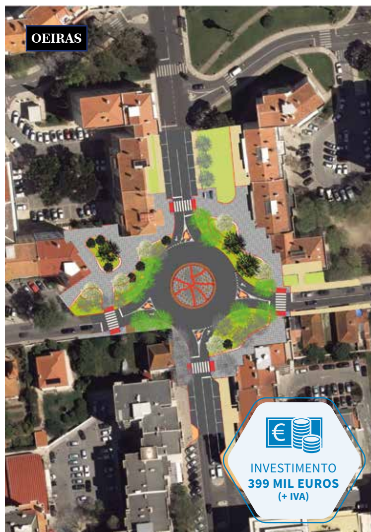
Proposta de reordenamento da Rua Oeiras do Piauí do Brasil, Avenida do Ultramar e Avenida Dr. Francisco Sá Carneiro, em Oeiras

Será ainda reforçada a arborização da zona, minimizando o impacto do corte de quatro árvores de grande porte existentes. As zonas verdes de enquadramento serão revestidas com herbáceas e pequenos arbustos, substituindo os atuais relvados, contribuindo para uma poupança nos custos de rega e manutenção.