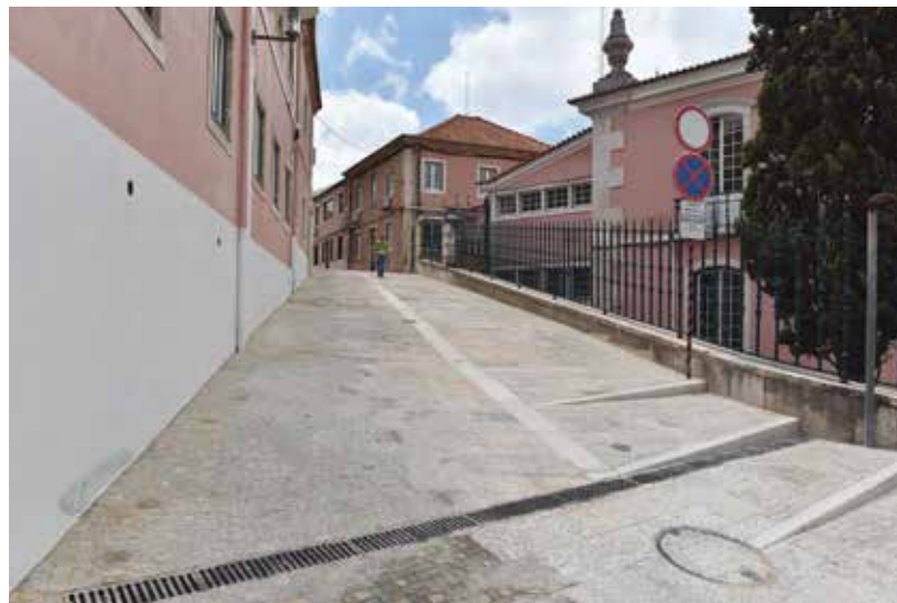
Rua 7 de Junho, concluída

Tratam-se de duas ruas pedonais, ligando o Largo 5 de Outubro ao Largo Marquês de Pombal.