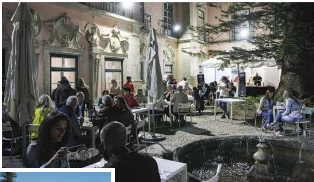
Jardins do Palácio Marquês de Pombal

Dar a conhecer e promover o Palácio do Marquês de Pombal, a sua riqueza patrimonial e histórica, divulgar a restauração e a gastronomia locais são os principais objetivos desta iniciativa. •