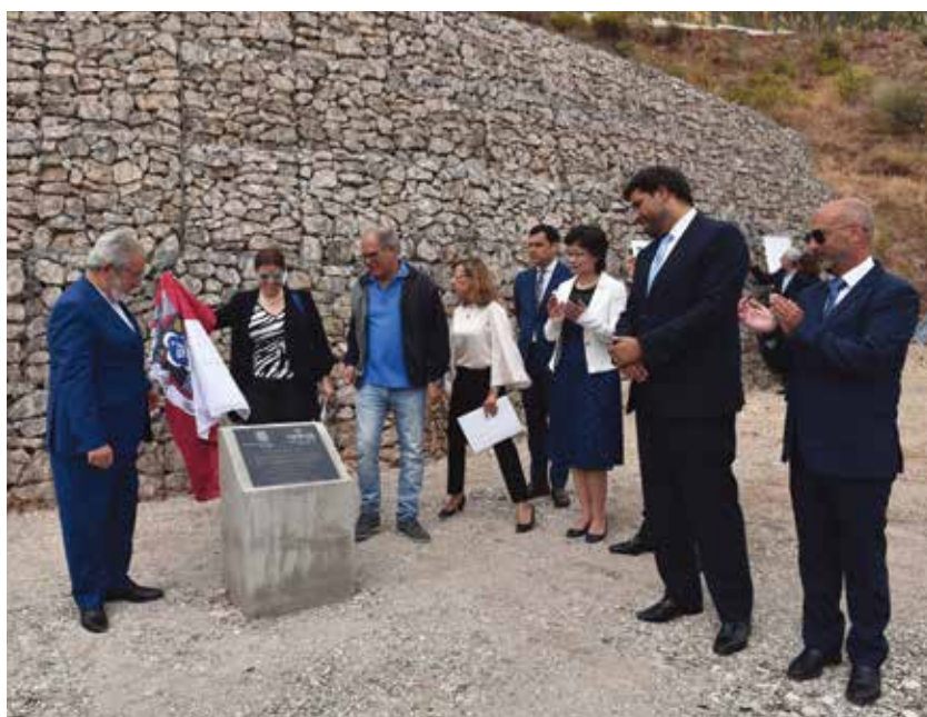
Cerimónia de colocação da primeira pedra, assinalando o início da obra