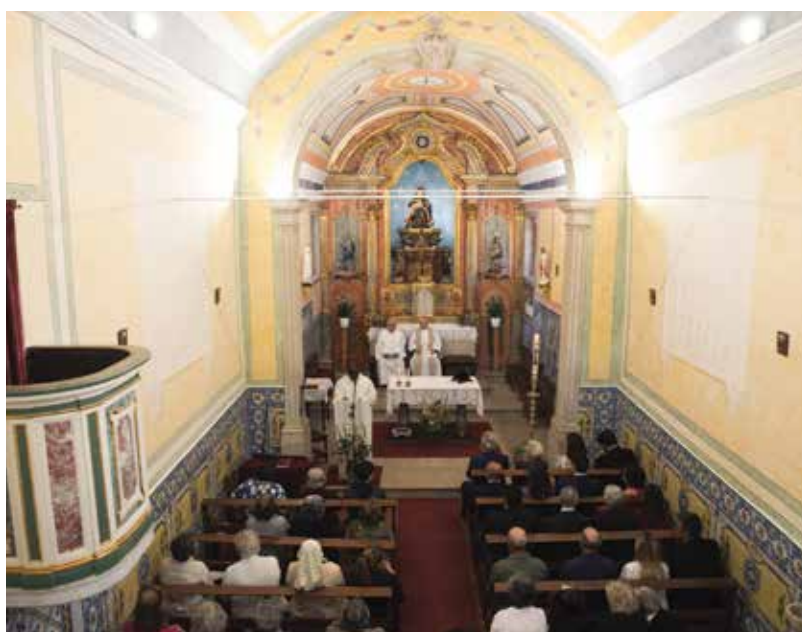
Restauro da Igreja de Nossa Senhora da Piedade, em Leceia

Neste caso, a obra contemplou a recuperação do recinto para a atividade desportiva informal e o aumento da capacidade de oferta de estacionamento (perpendicular à Rua Moinho de Vento). Procedeu-se ainda ao reforço da iluminação pública na envolvente, num investimento global de 110 mil euros (+ IVA).