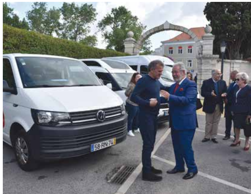
Atribuição de sete ambulâncias aos bombeiros do concelho e de cinco carrinhas de transporte de doentes a IPSS locais