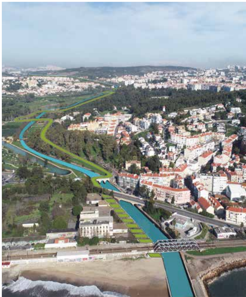
1ª Fase: Cruz Quebrada/Senhora da Rocha