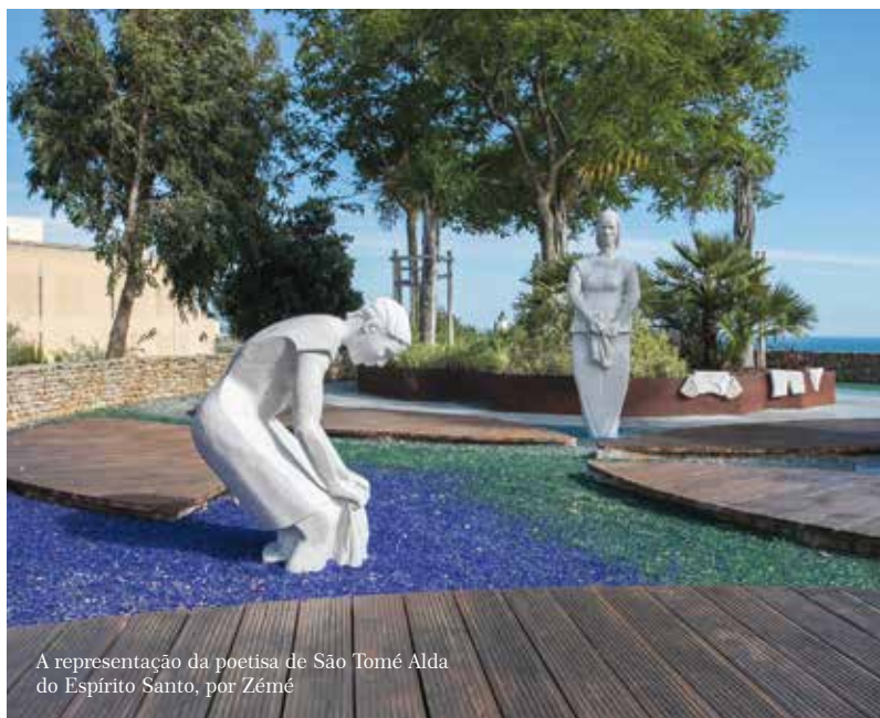
A representação da poetisa de São Tomé Alda do Espírito Santo, por Zémé

Os conjuntos escultóricos da autoria do também santomense José Manuel Mendonça Gracias, também conhecido por Zémé, e do português Charters de Almeida foram inaugurados no dia 8 de junho. •