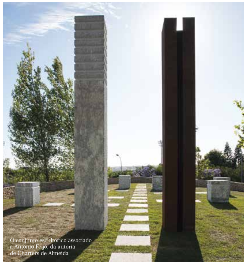
O conjunto escultórico associado a António Feijó, da autoria de Charters de Almeida