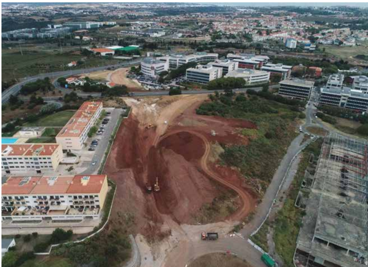
A obra de construção do viaduto já está em curso

A sua localização, num dos nós rodoviários mais importantes do concelho, onde se articula o tráfego dos vários parques empresariais (Lagoas Parque, TagusPark e Quinta da Fonte), com as entradas e saídas da A5, confere elevados níveis de procura de tráfego, principalmente nas horas de ponta, constituindo congestionamentos e consequentemente filas de espera e tempos de atraso.