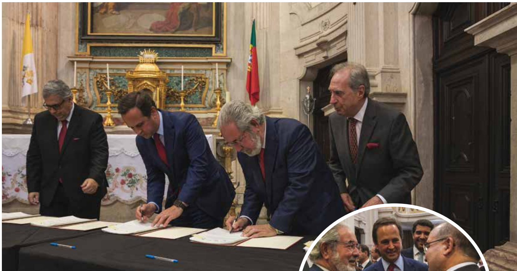
Armindo Azevedo, vice-presidente da Fundação Marquês de Pombal, os presidentes das câmaras municipais de Lisboa e de Oeiras, Fernando Medina e Isaltino Morais, e António Monteiro, presidente da Fundação Millennium BCP

I nvestigar e editar todo o trabalho escrito pelo Marquês de Pombal – ou por si diretamente inspirado – são os objetivos do projeto Obra Completa Pombalina. O arranque foi dado com a assinatura de um protocolo entre os presidentes das câmaras municipais de Oeiras e de Lisboa. Na ocasião, Isaltino Morais voltou a referir-se à urgência subjacente à requalificação e preservação do património histórico do concelho.