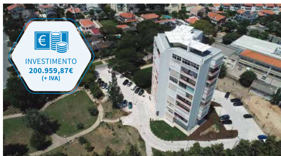
Vista aérea do espaço envolvente à Torre H, Nova Oeiras

A Câmara Municipal tem vindo a realizar a requalificação da envolvente das diferentes torres características do bairro de Nova Oeiras, tendo sido recentemente concluída a obra da envolvente da Torre H.