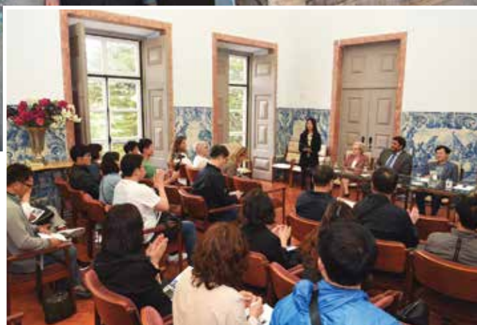
Momento da visita da delegação da Coreia do Sul

Recorde-se que este acordo é válido por um período de cinco anos, automaticamente renováveis, e visa promover a cooperação amigável, a prospe-