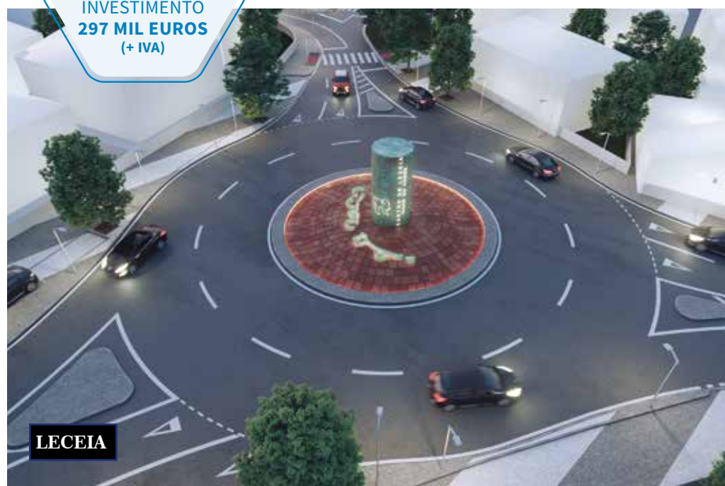
Rotunda da entrada de Leceia (antigo mercado)