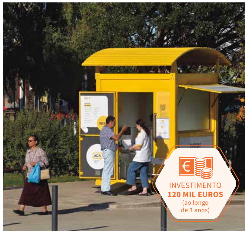
Primeiro Quiosque da Saúde do concelho já funciona em Carnaxide

“A ideia não é substituir o Serviço Nacional de Saúde, mas, sim, atuar em complementaridade, facilitando o acesso dos cidadãos, sobretudo os que se encontram em situações mais vulneráveis, aos cuidados de saúde de primários, ajudando na prevenção da doença”, explica o presidente da Câmara Municipal de Oeiras, Isaltino Morais, acrescentando que “sempre que se justifique, os utentes serão encaminhados para o centro de saúde ou para o hospital”.