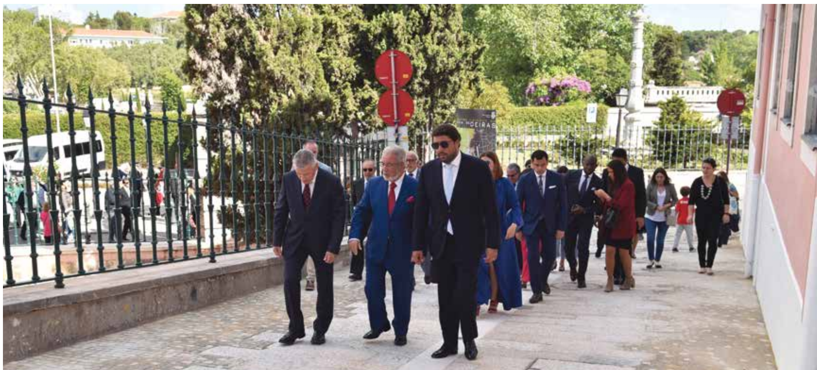
Assinalada a conclusão das obras de requalificação da Rua 7 de Junho de 1759, em Oeiras

O Dia do Município de Oeiras, 7 de junho, foi celebrado com a atribuição, pela Câmara Municipal, de sete ambulâncias aos bombeiros do concelho e de cinco carrinhas de transporte de doentes a IPSS locais.