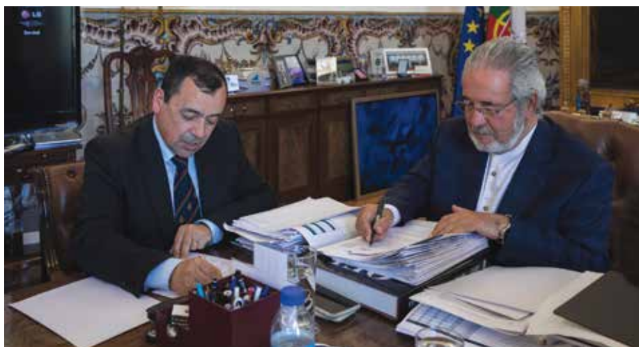
Assinatura do protocolo com o Centro Nacional de Cibersegurança

Com a tecnologia como core do desenvolvimento do seu território, o Município de Oeiras ambiciona ser um Município de referência nacional também na área da cibersegurança, consolidando, ao mesmo tempo, o seu posicionamento de vanguarda ao nível da inovação e do desenvolvimento tecnológico.