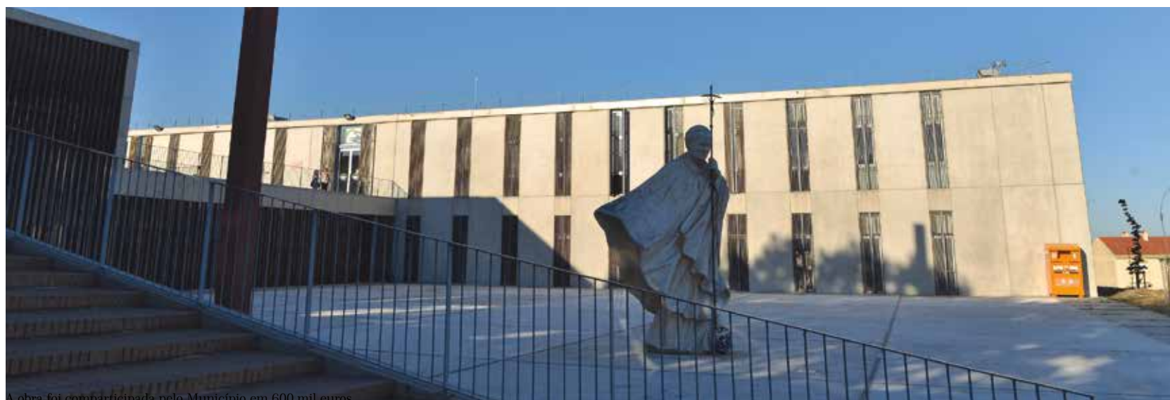
A obra foi comparticipada pelo Município em 600 mil euros