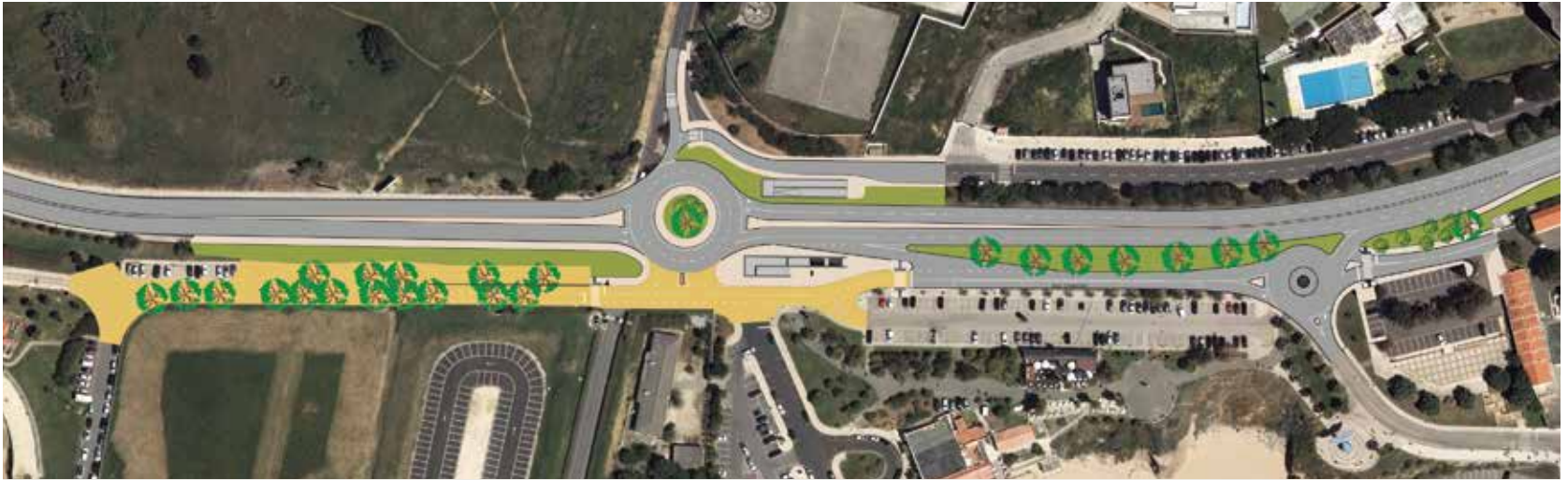
Avenida Marginal – Rotunda de São Julião da Barra