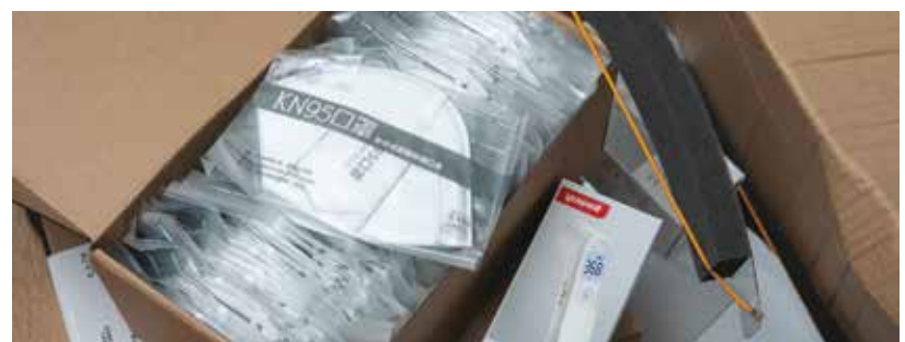
Material entregue aos hospitais e a todas as profissões essenciais