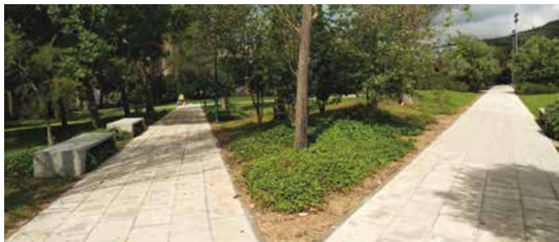
Passadiços do jardim, na Outurela, Carnaxide

mento de 40.100 €), na Rua João XXI e Estrada das Várzeas, em Queijas (investimento de 189.150 €), nos passadiços do Jardim da Outurela, em Carnaxide (investimento de 52.840 €).