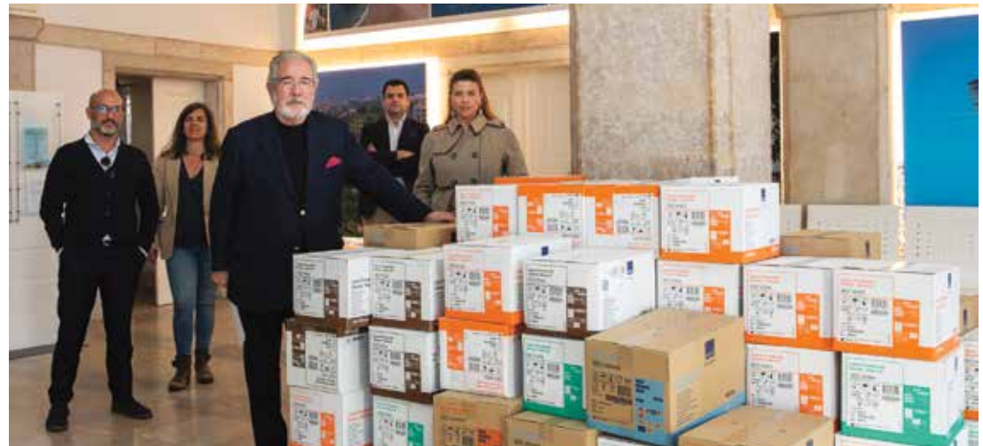
Entrega de luvas