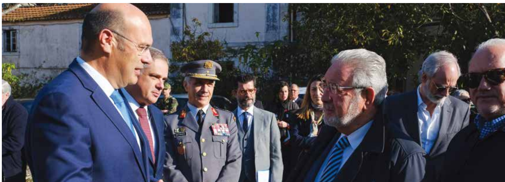
O projeto Revive é um programa do Governo que abre o património ao investimento privado para desenvolvimento de projetos turísticos, através de concursos públicos

Os jardins, esculturas e salas com pintura decorativa do Paço Real de Caxias estão classificados como imóvel de interesse público.