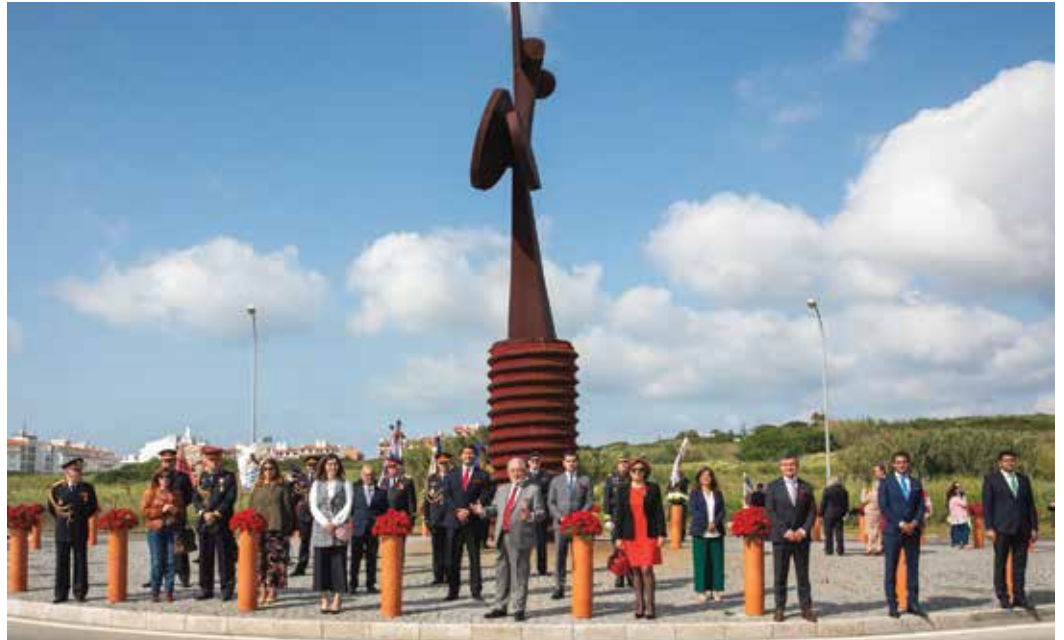
Deposição de flores no monumento alusivo ao 25 de abril