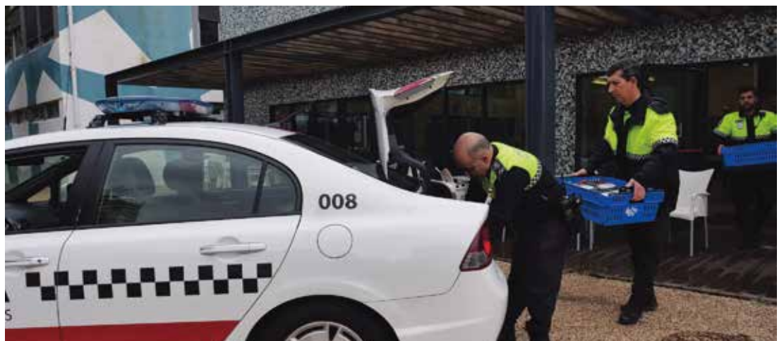
Entrega de refeições gratuitas aos profissionais das funções essenciais