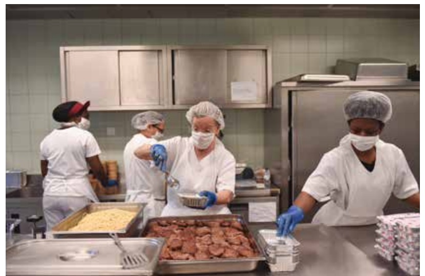
Confeção de refeições para profissionais de funções essenciais e famílias carenciadas