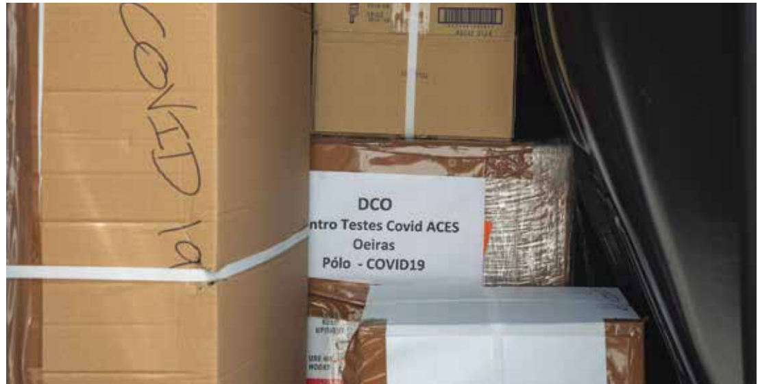
Abertura do centro de testes COVID19 em Oeiras