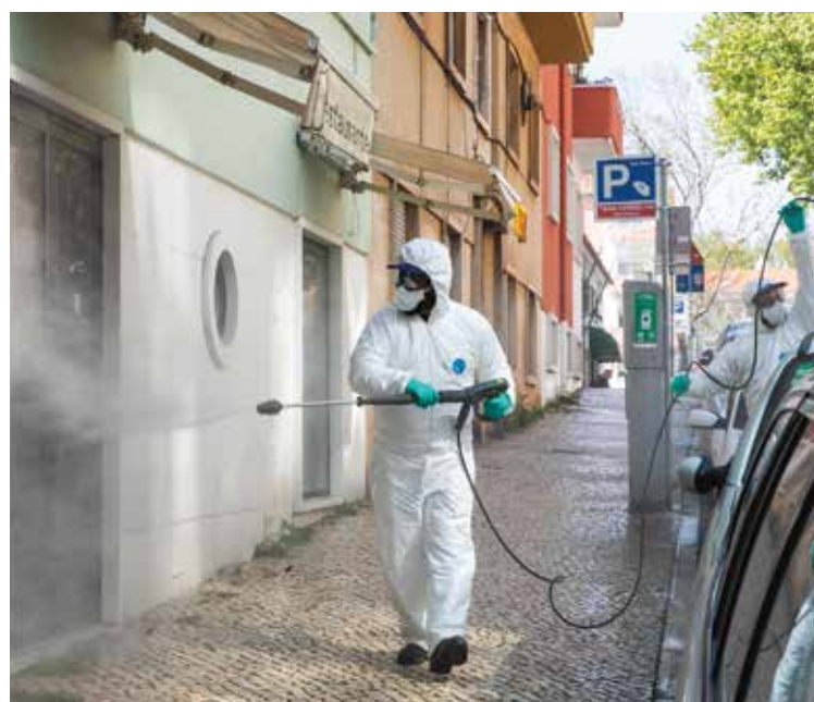
Higienização de ruas e equipamentos no espaço público

No entanto, para uma operação de recolha de resíduos eficaz todos têm o dever de cooperar. •