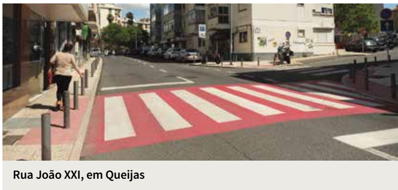
Rua João XXI, em Queijas