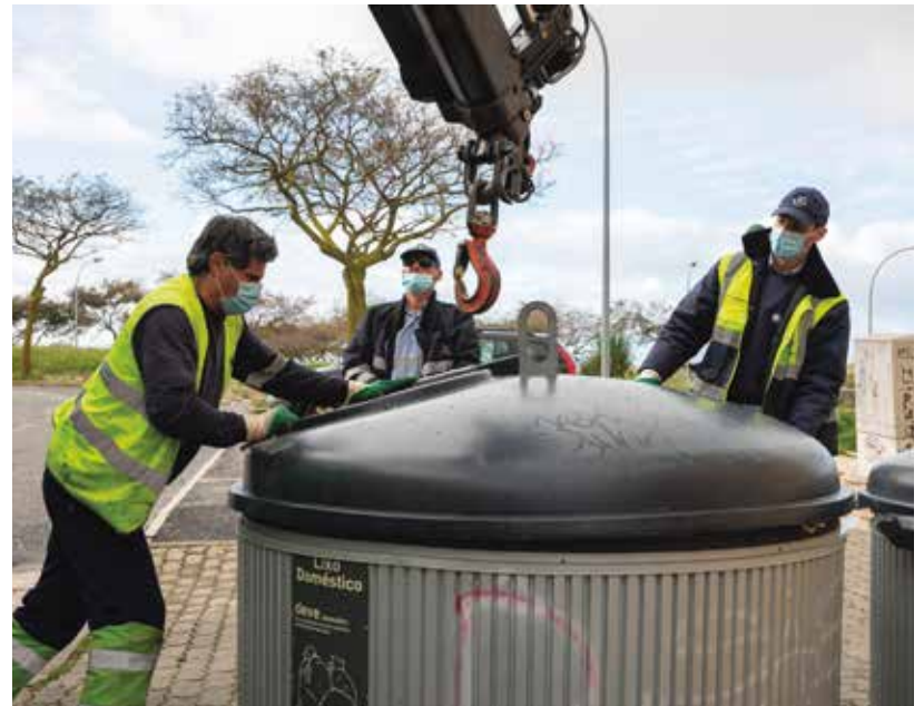
Recolha de lixo garantida pelos funcionários do Município