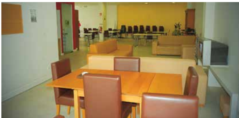
Casa para acolhimento de pessoas sem abrigo em Paço de Arcos