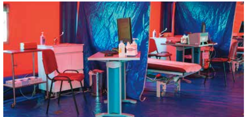
Abertura do centro de testes COVID19 em Oeiras