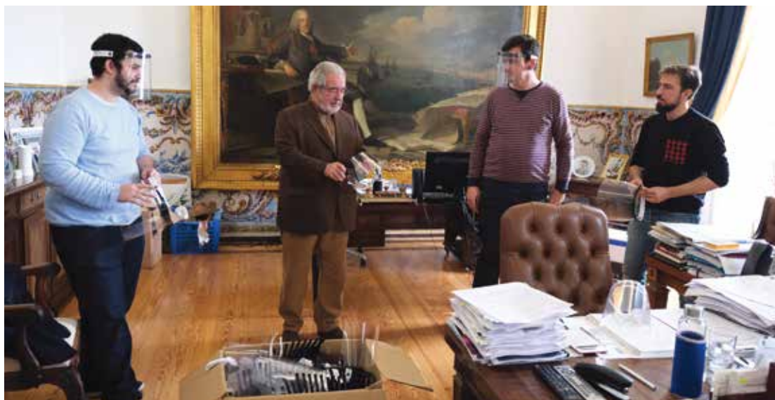
Entrega de viseiras de proteção

Este apoio concretizou-se na compra de 2400 peças de vestuário hospitalar, 43 ventiladores, 90 seringas elétricas, 500 fatos de proteção, 140 óculos de proteção, 50.000 máscaras, diverso material informático e telecomunicações.