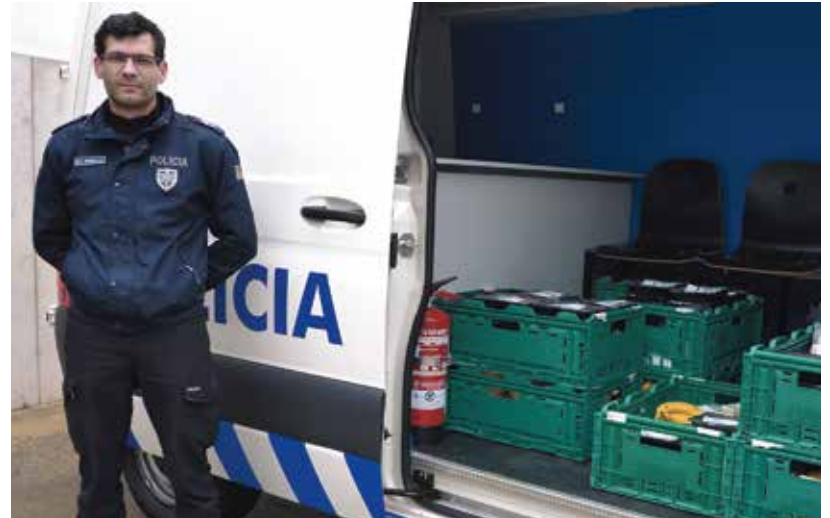
Entrega de refeições gratuitas aos profissionais das funções essenciais