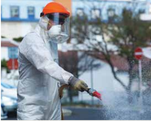
Higienização de ruas e equipamentos no espaço público