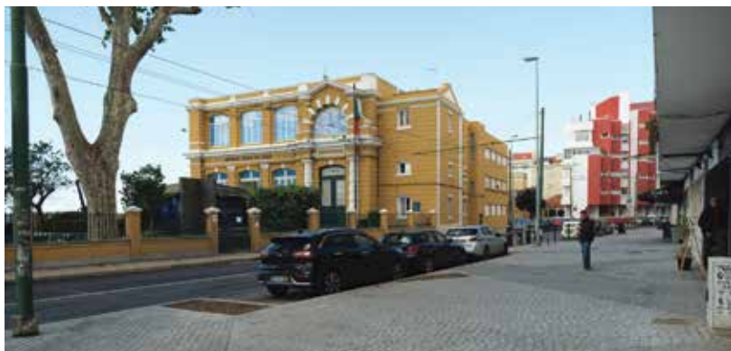
Zona pedonal e de esplanadas no Dafundo

Neste sentido já se encontram concluídas as obras realizadas na Avenida Copacabana, em Oeiras (investimento de 27.565 €), na Rua Cândido dos Reis, em Oeiras (32.380 €), na Avenida Rio de Janeiro, Avenida Embaixador Augusto Castro e Rua da Junção do Bem, também em Oeiras (investimento de 70.150 €), na Rua Helena Aragão, em Tercena (investi-