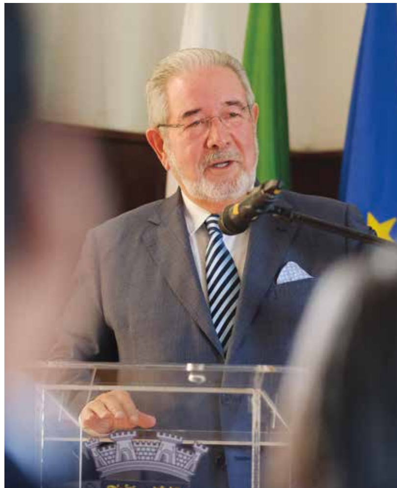
O presidente da Câmara Municipal de Oeiras, Isaltino Morais