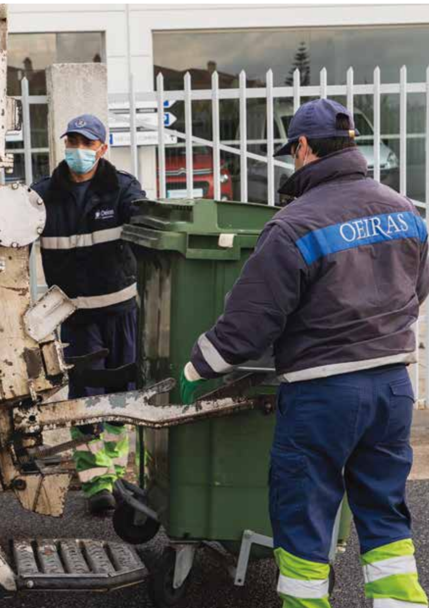
Recolha de lixo garantida pelos funcionários do Município

Estas medidas contribuem para tornar o processo de deposição e de recolha de resíduos mais seguro, tanto para os trabalhadores do Município como para os munícipes. •