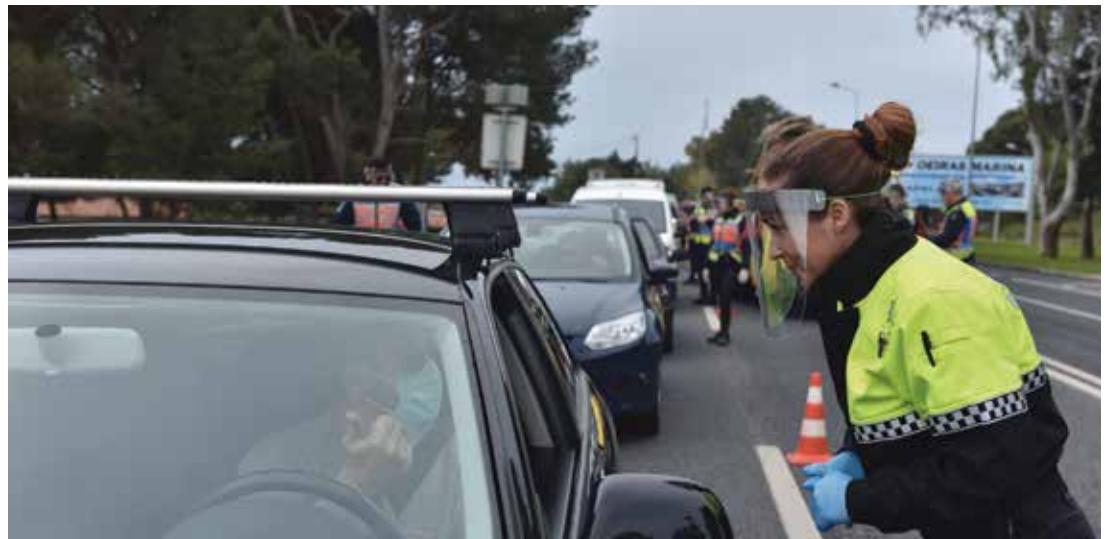
Cumprimento das normas de circulação garantida pela Polícia Municipal e pela Polícia de Segurança Pública