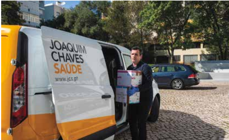
Sistema de testes de infeção por COVID-19, em parceria com a Clínica Joaquim Chaves