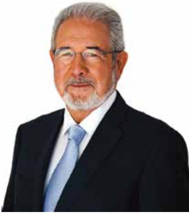
O PRESIDENTE, ISALTINO MORAIS

É um lugar-comum dizer-se que as crises revelam o melhor e o pior dos seres humanos. Mas não deixa de ser verdade.