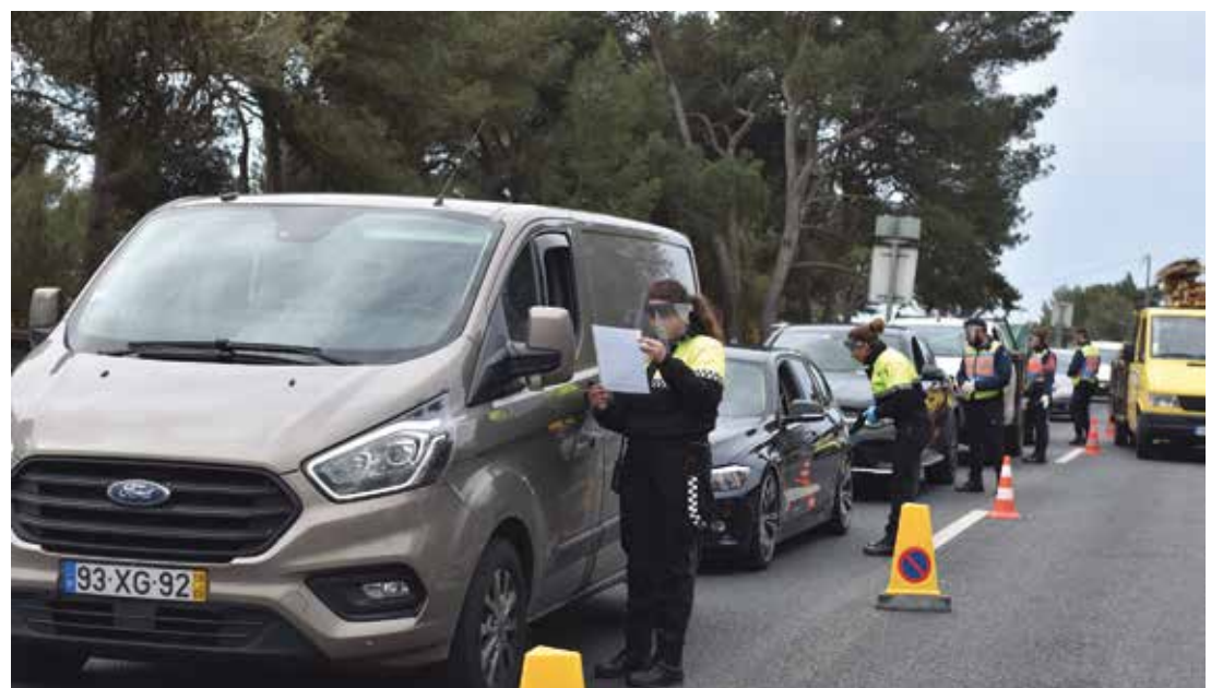
Cumprimento das normas de circulação garantida pela Polícia Municipal e pela Polícia de Segurança Pública