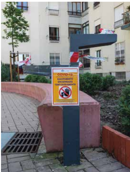
Equipamentos municipais encerrados