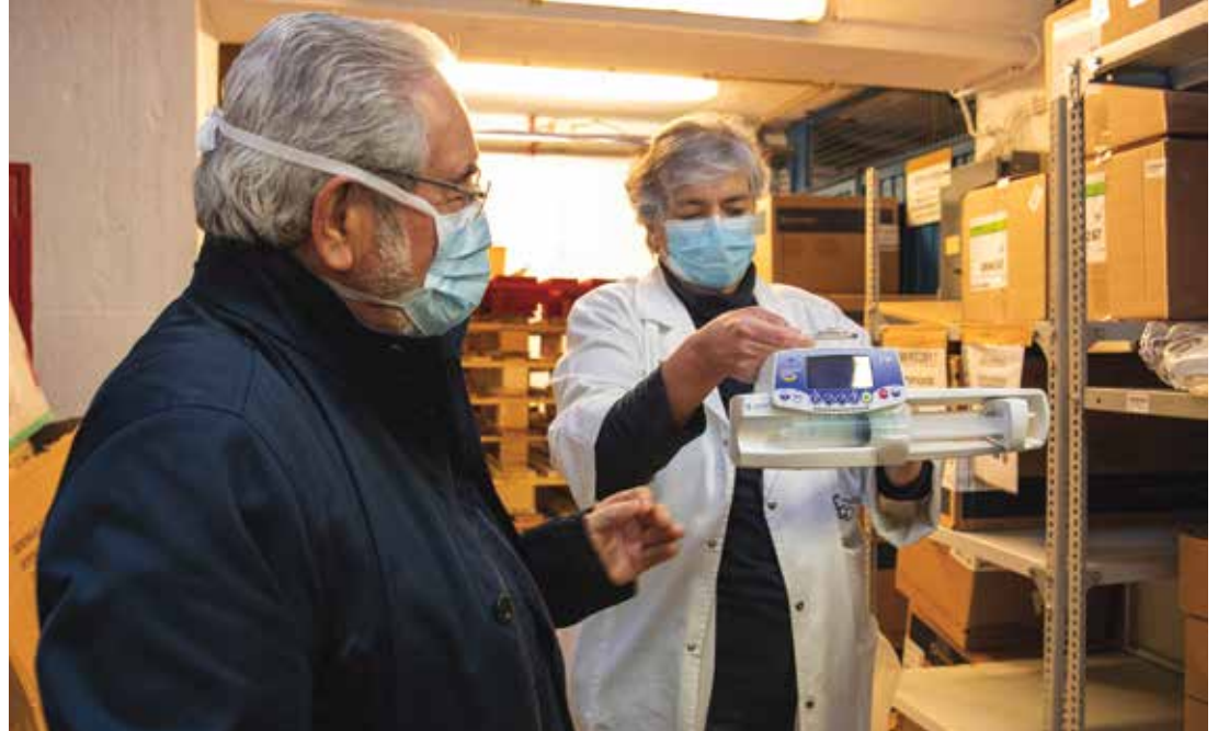
Entrega de seringas elétricas ao Hospital São Francisco Xavier