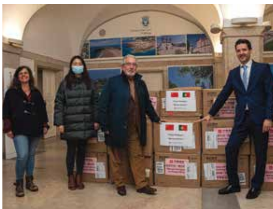
Entrega de material China Construction

mo-nos uns aos outros. Compreendamos o medo de cada um, por si e pelos seus. Porém, não deixemos que o medo tome conta das nossas ações, nos cegue e nos impeça de, com calma, coragem e confiança, ver como podemos ter futuro. Ultrapassar esta pandemia está, sobretudo, nas nossas mãos e nas nossas ações. •