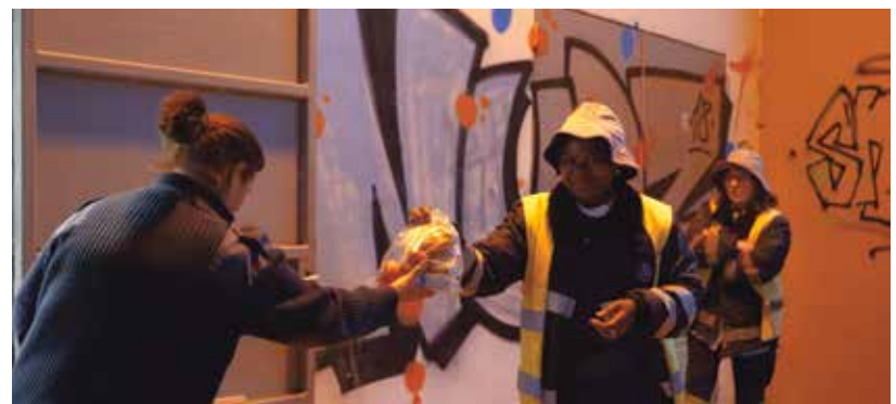
Entrega de refeições gratuitas aos profissionais das funções essenciais