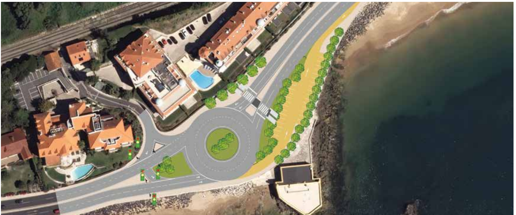
Avenida Marginal – Rotunda da Curva dos Pinheiros