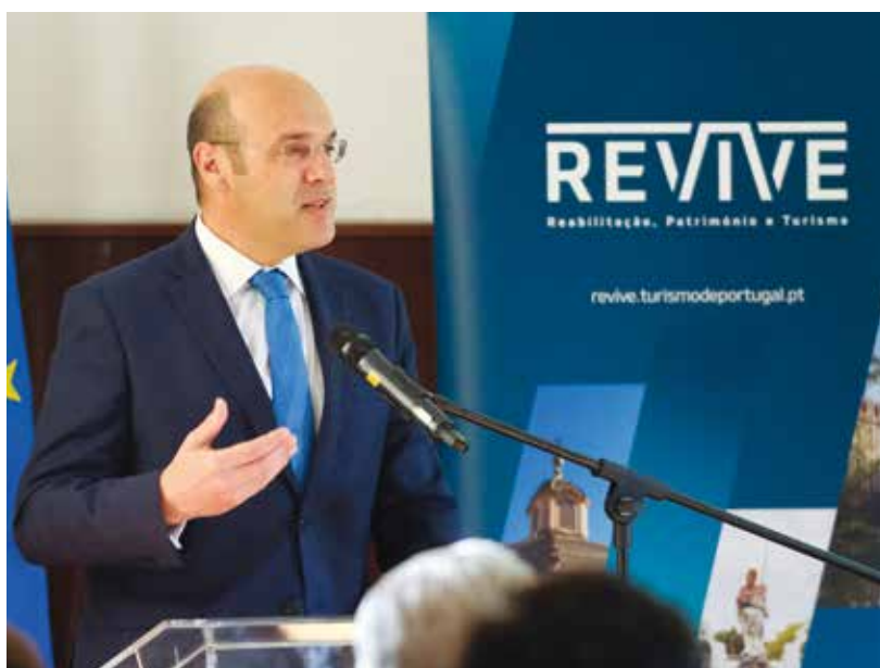
O ministro de Estado, da Economia e da Transição Digital, Pedro Siza Vieira

A cerimónia contou com a presença do presidente da Câmara Municipal de Oeiras, Isaltino Morais, do ministro de Estado, da Economia e da Transição Digital, Pedro Siza Vieira, do secretário de Estado Adjunto da Defesa Nacional, Jorge Seguro Sanches e da secretária de Estado do Turismo, Rita Marques. •