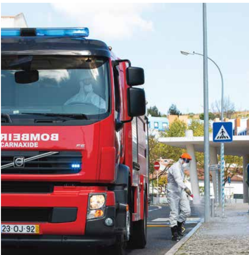
Higienização de ruas e equipamentos no espaço público