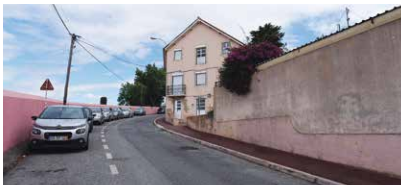
Rua Junção do Bem, em Oeiras

Em curso estão as obras na Rua Conde de Alcáçovas, em Paço de Arcos (investimento de 277.206 €) e nas ruas Egas Moniz, Joseph Black, João das Regras e da Mata de São Mateus, em Linda-a-Velha. •