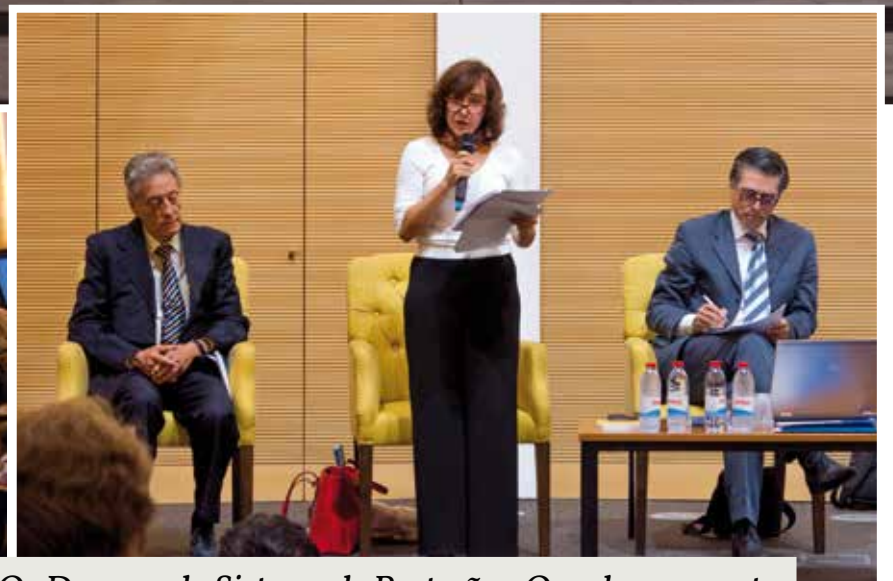
(...) ‘Os Degraus do Sistema de Proteção - Os colos, as pontes e os desafios’, inserida num ciclo de conferências intitulado ‘Olhares sobre a Infância’.