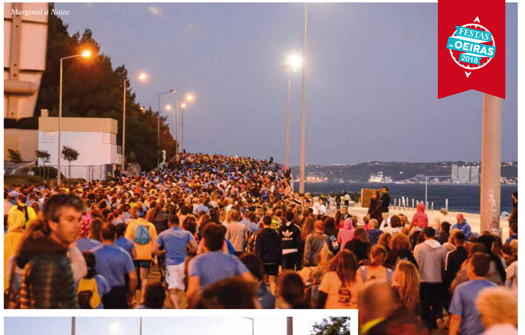
Marginal à Noite

Recorde-se que a Festa do Cavalo de Porto Salvo é um evento anual, organizado pela Associação Equestre de Porto Salvo com o apoio da Câmara Municipal de Oeiras, que tem como objetivo estimular a prática do desporto equestre e proporcionar um espaço de convívio e competição.-