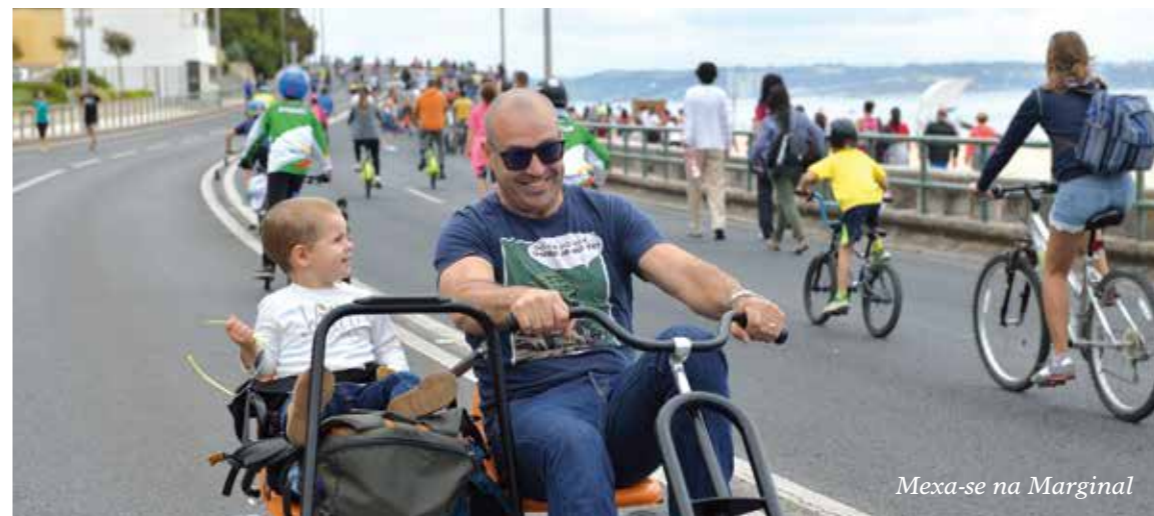
Mexa-se na Marginal