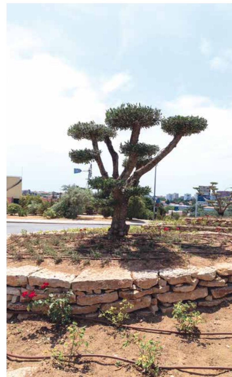
Requalificação paisagística da envolvente à Avenida Copacabana (Oeiras)