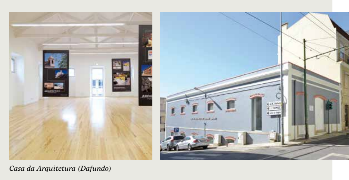
Casa da Arquitetura (Dafundo)

Preservar a memória e a identidade do edifício que começou por ser industrial e chegou a ser utilizado como salão de baile dos bombeiros foram duas preocupações que nortearam a obra de recuperação do espaço agora designado por Casa da Arquitetura, no Dafundo. A obra visou a criação de um espaço no qual a comunidade possa ser envolvida no pensamento, no trabalho e no processo criativo dos arquitetos. Nesse sentido está prevista a realização de seminários, conferências e outras iniciativas promovendo a reflexão em torno do tema da arquitetura, a par da cooperação com instituições de ensino, organizações e associações culturais ou empresariais. O valor da empreitada foi de 155.820,00€.