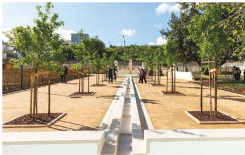
imagem de um pomar de recreio, com uma alameda dupla de amendoeiras ladeando um canal de água que se desenvolve em cascata, ligando dois tanques.

Noutra zona, uma grande área relvada delimitada por arbustos, menos exposta e mais protegida, convida à estadia.