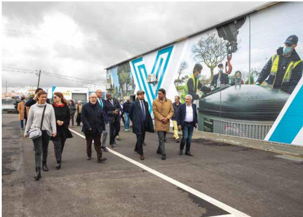
Inauguração do renovado Estaleiro Municipal Sul de Porto Salvo

O presidente da Câmara Municipal de Oeiras, Isaltino Morais, inaugurou, no dia 21 de março, o renovado Estaleiro Municipal Sul de Porto Salvo, destinado a trabalhadores do Município. Depois de requalificado o Estaleiro Norte de Porto Salvo, foi agora a vez de renovar toda a parcela do Estaleiro Sul, de modo a garantir instalações sanitárias e zonas para armazenamento e funcionamento de alguns dos serviços operacionais municipais.