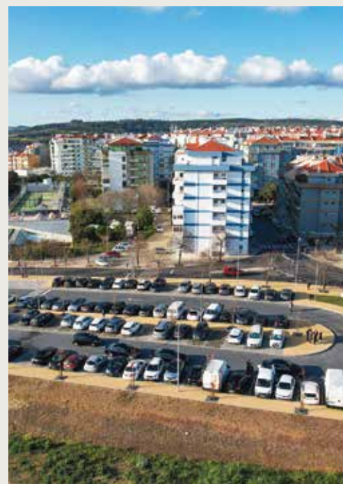
Novo parque de estacionamento da Avenida Duque de Loulé, em Linda-a-Velha

No mesmo dia foi também inaugurado o novo parque de estacionamento da Avenida Duque de Loulé, em Linda-a-Velha. Trata-se de um investimento municipal de mais de 470 mil euros que permitiu criar 170 novos lugares de estacionamento, seis dos quais destinados a pessoas com mobilidade reduzida. •