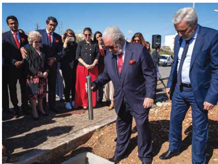
Colocação da primeira pedra da Alameda da Zona C, no Bairro do Casal da Choca

O presidente da Câmara Municipal de Oeiras inaugurou no dia 25 de abril a empreitada de requalificação dos espaços exteriores da Quinta da Estrangeira, promovida no âmbito do processo de reconversão desta área urbana sob gestão do Gabinete Técnico Local.